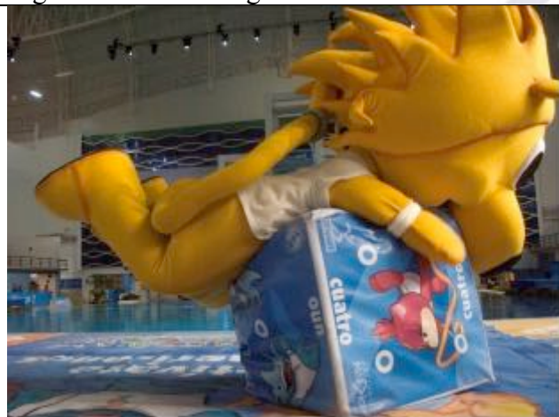
Participação do Mascote no Ginásio