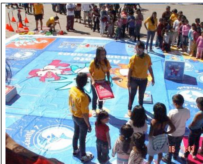
Jogo em tabuleiro Gigante