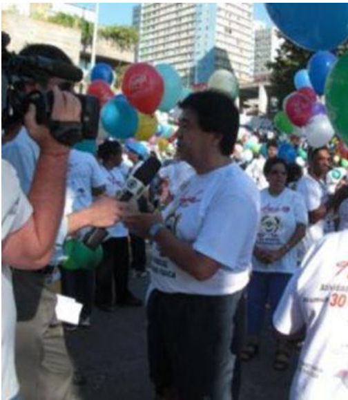
Entrevista TV - Rede Globo