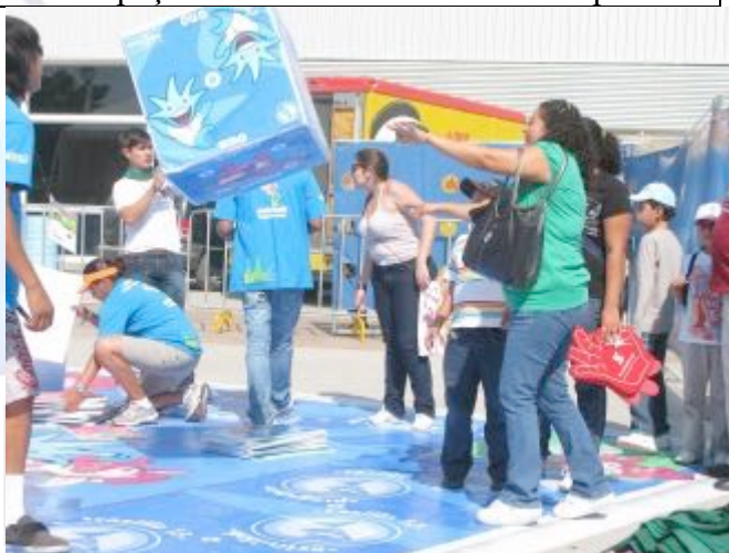
A atividade é destinada a toda família

CENTRO DE ESTUDOS DO LABORATÓRIO DE APTIDÃO FÍSICA DE SÃO CAETANO DO SUL