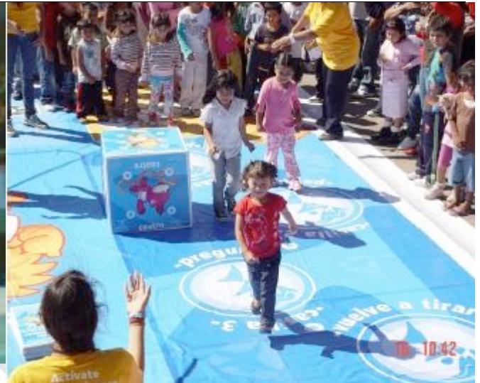
Atividades com as crianças