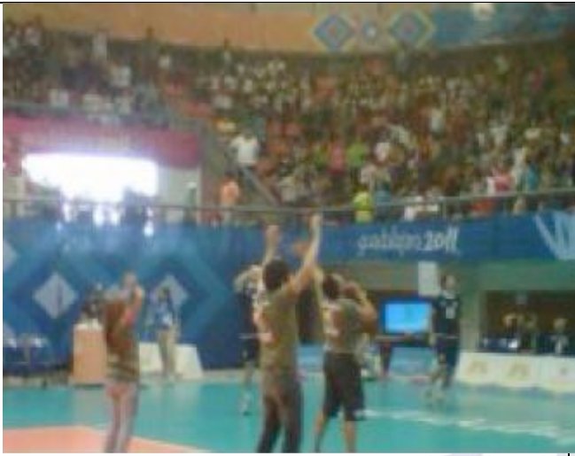
Atividades dentro do Ginásio