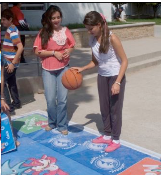
Cada espaço no tabuleiro incentiva um esporte